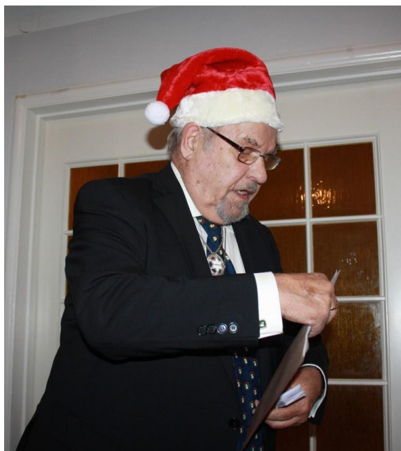
Tomtefar "Smirre" skötte med van hand julklappsutdelningen...

"Smirre" underhöll bröderna med finurliga och underfundiga julklappsrim och stämningen var hög!